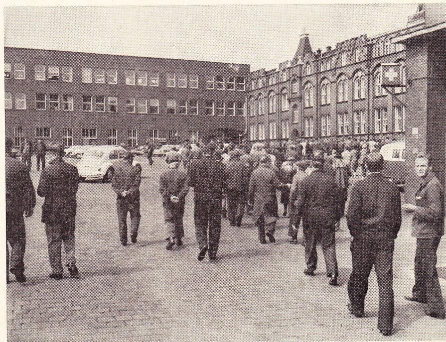
19. Mai, 11.30 Uhr: Die Belegschaft kehrt an die Arbeitsplätze zurück

Hier hat sich jedenfalls gezeigt, wozu die Arbeiterschaft in einer außergewöhnlichen Lage fähig ist, und daß sie dann auch vom größten Teil der Bevölkerung verstanden wird. Das ist ermutigend, und es ist beispielhaft. Wie es künftig auch gedeutet werden mag, eines ist sicher: Es war eine Stunde der Wahrheit.