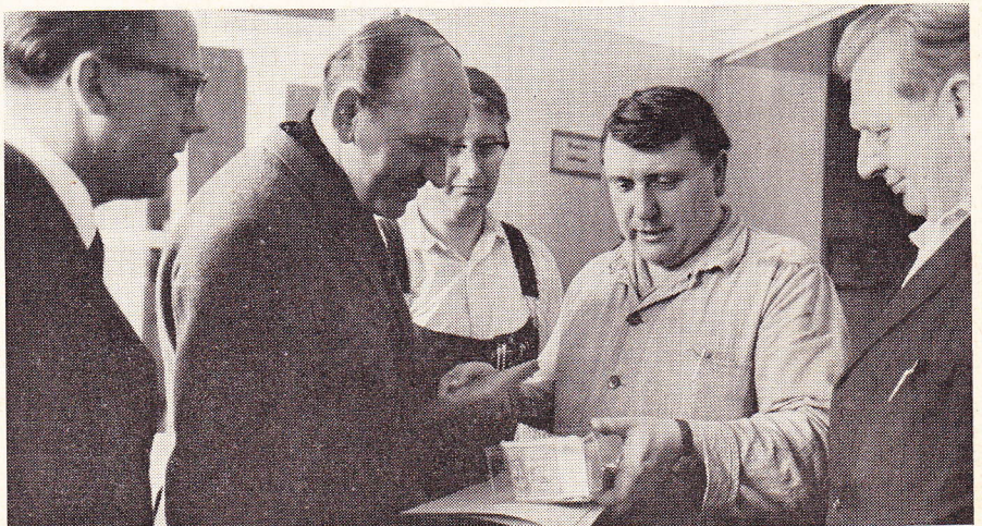
Arbeiter eines Kleinbetriebes überbringen ihren Kollegen eine Spende

Doch dann geschah nichts weiter. Im Gegenteil, die Situation besserte sich. Mehr Arbeit wurde verlangt, Überstunden, und es wurden auch zusätzliche Kräfte eingestellt. So