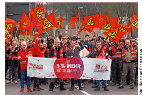
☛ Über 7500 Beschäftigte beteiligten sich bundesweit an Warnstreiks.

7500 Beschäftigte. »Tarifverträge sind kein Automatismus«, so Wente. »Sie entstehen durch kollektive Durchsetzungskraft. Fair ist, dass diejenigen besonders profitieren, die diese Stärke tragen.«